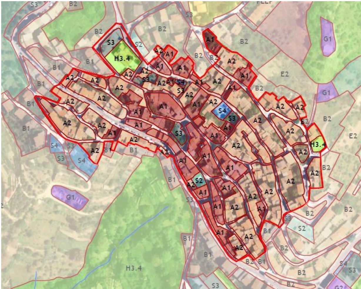
Il centro storico di Seulo. In rosa le zone A2 in attesa di nuovo Piano Particolareggiato.