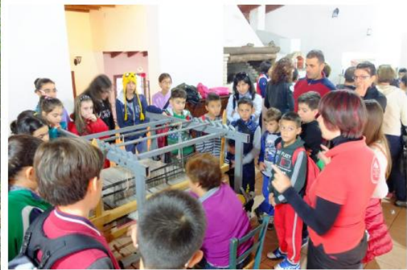
Laboratorio della tessitura