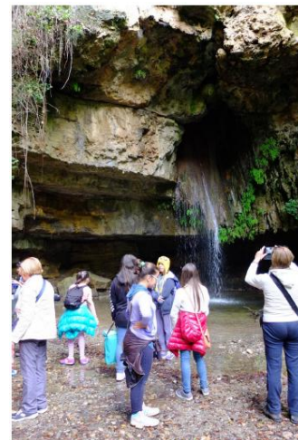
Su stampu de su turru