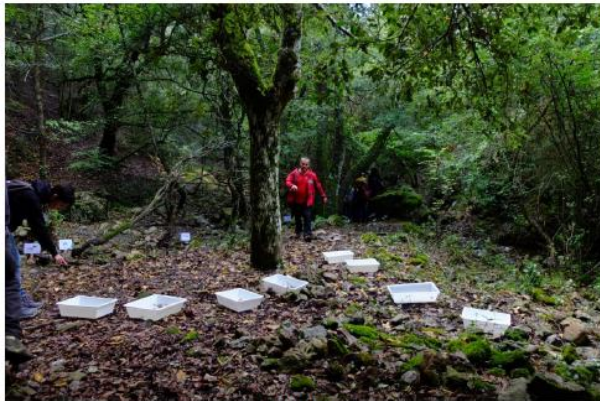
Laboratorio delle acque

Dotazione da piano finanziario € 9.000,00 azione realizzata con una spesa di € 8.978,41.