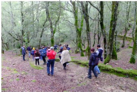
Parte l'escursione verso le grotte

Organizzazione di laboratori "attivi" dedicati ai bambini, ai ragazzi, alla cittadinanza, per l'educazione allo sviluppo sostenibile, alla valorizzazione del patrimonio locale, al fine di rafforzare il senso di appartenenza e la riscoperta dell'identità dei luoghi e costituire un'opportunità di rivitalizzazione di saperi artigianali da far scoprire negli ecomusei che potranno utilizzarli per il rilancio della propria immagine e identità culturale.