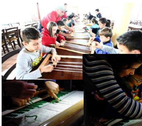
Laboratorio della tessitura in pratica....