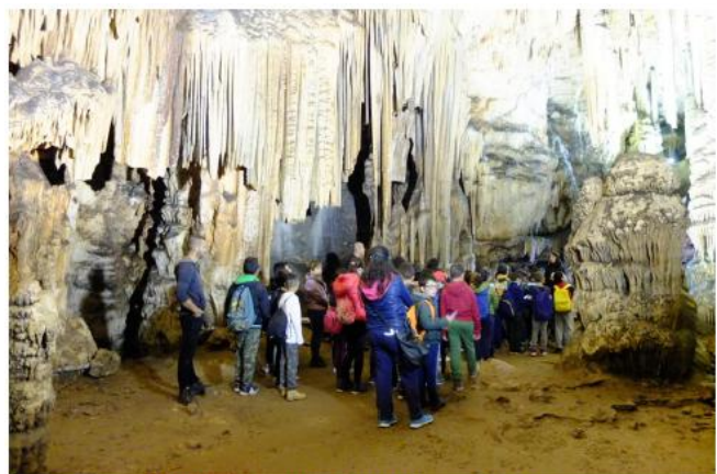
Un gruppo di ragazzi si intrattiene a fare domande

A completamento dell'esperienza laboratoriale e nell'ambito della stessa giornata sono previste anche visite ai siti Naturalistici gestiti dagli ecomusei con guide e organizzazione di attività collaterali come orienteering, il tutto è stato realizzato con il coinvolgimento degli operatori locali, artigiani, agricoltori, ecc. Sono state organizzate visite guidate bilingue